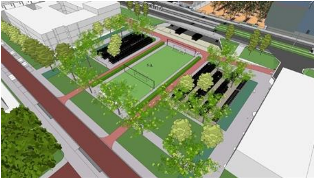
Ontwerp tijdelijke bovengrondse fietsenstallingsplaatsen

De projectorganisatie Zuidasdok en de gemeente Amsterdam zijn met de omgeving in gesprek gegaan over een tijdelijke fietsenstalling op de Vijfhoek, het parkje op de kop van de Minervalaan. Er zijn meerdere locaties aangedragen en onderzocht, maar niet geschikt bevonden. In een vijftal ontwerpessies is er samen een mooi ontwerp gemaakt voor een tijdelijke bovengrondse fietsenstalling op de Vijfhoek.