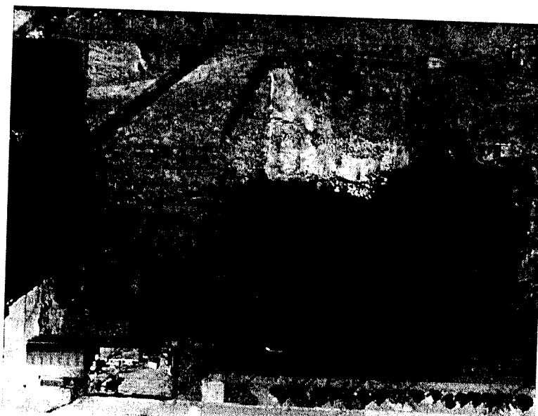
Feitelijke situatie projectgebied

De projectlocatie bestaat uit braakliggend terrein. Er bevinden zich geen bomen of bosschages. De feitelijke situatie van de projectlocatie is op onderstaande luchtfoto in beeld gebracht, waarbij wordt opgemerkt dat de boom inmiddels niet meer aanwezig is.