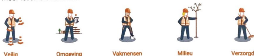
afbeelding 1; bewuste bouwers

Dit project is aangemeld bij Bewuste Bouwers. Bewuste Bouwers wil de relatie tussen bouwplaats en omgeving transparant maken door het stimuleren en bevorderen van goede communicatie en een goede uitstraling van de bouwplaats. Het bouwterrein en al onze medewerkers hebben zich gecommitteerd aan de uitgangspunten van Bewuste Bouwers. U kunt op www.verbeterdebouw.nl uw bevinden met ons delen en op ww.bewusterbouwer.nl meer lezen dit initiatief.