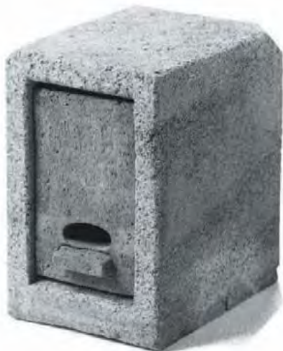
Neststeen voor vleermuis